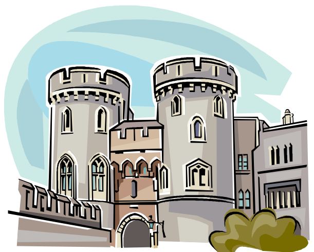
Fernando Villalba, Borja Colilla, Sergio Cuesta

Détruire un château de conte de fée ? Les 8 000 amoureux du château de Noisy en Belgique, près de la frontière française, s'y refusent ; le propriétaire invoque des raisons de sécurité. Le gouvernement wallon étudie le dossier.